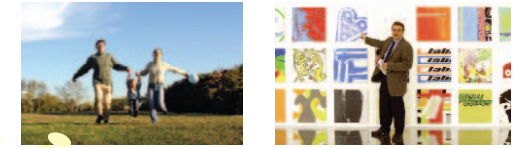
Mit Hauke Jagau wird die Region familienfreundlicher.

Mit Hauke Jagau als Präsident wird die Region familienfreundlicher. Damit Familie und Beruf besser vereinbar werden, will er zusammen mit den Gemeinden die Bildung und Betreuung der Kinder verbessern und weitere Ganztagschulen einrichten. „Die Förderung muss mit der frühkindlichen Bildung beginnen und bis zu einer erfolgreichen Berufsausbildung reichen. Gerade weil wir immer weniger Kinder haben, müssen diese bestmöglich ausgebildet werden. Die Eltern sollen wissen, dass ihre Kinder in der Zeit, in der sie arbeiten, gut und verlässlich betreut werden.“