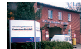
Ob Krankenhaus-Fusion oder Gartenregion... wir gestalten Zukunft.

Menschen, die hilfsbedürftig oder in Not sind, müssen sich auf eine gute Krankenhausversorgung, auf Beratungsstellen und öffentliche oder private Hilfsangebote verlassen können. Insbesondere der demografische Wandel wird endlich ernst genommen. Hauke Jagau's Konzept heißt „Sicher leben im Alter“ und wird für mehr altersgerechte Wohnungen und mobile Betreuung am Lebensort älterer Menschen sorgen.